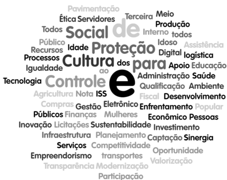
Figura 2 Chuva de Palavras (Tag Cloud)

O plano de governo do candidato a prefeito de Marechal Thaumaturgo está pautado em valores essenciais na gestão pública que trarão resultados concretos, traduzidos na tag cloud 2 descrito na figura 3.